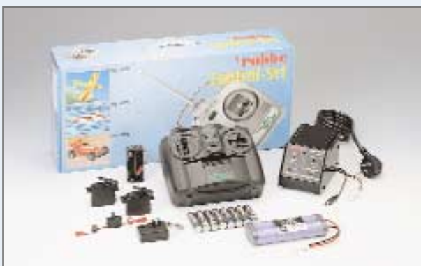
Control Set Car E No. F 8872