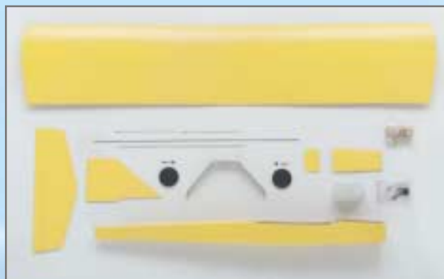
Teile, fertig gebaut und bespannt