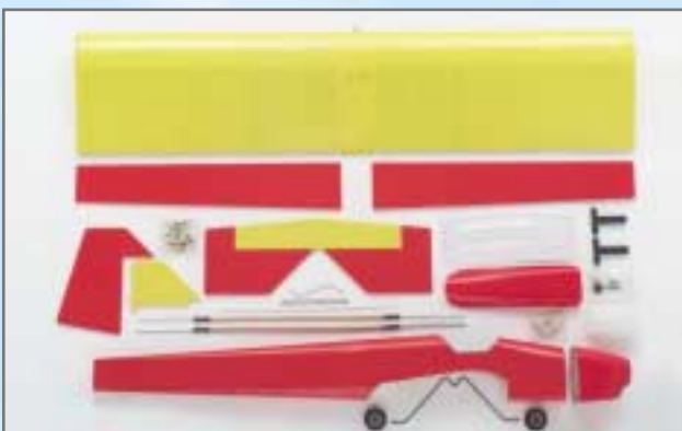
Teile, fertig gebaut und bespannt